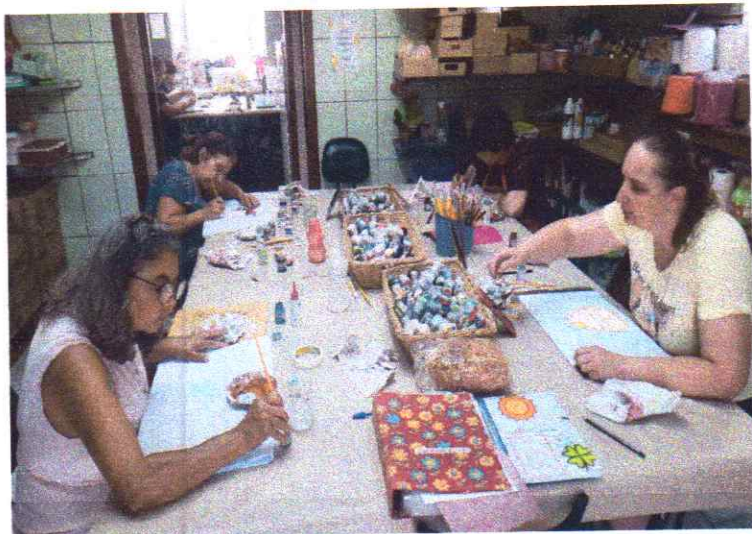
Turma da manhã